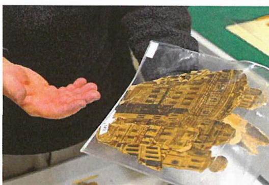
nejstarší část betléma – fragment města