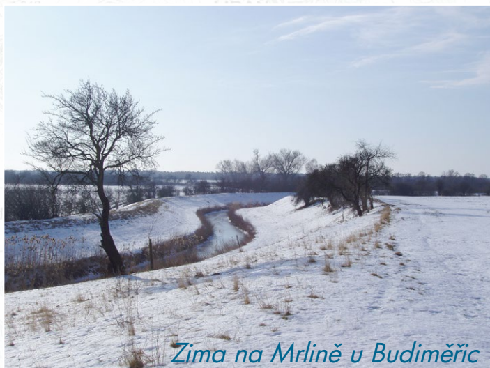
Zima na Mrlině u Budiměřic